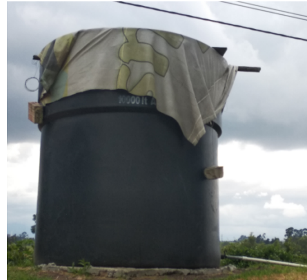
Fotografía 4. Tanque de almacenamiento de agua potable capacidad de 10000 litros