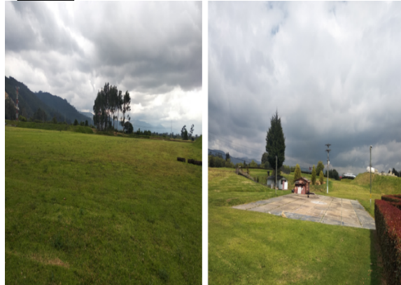
Fotografía 2. Vista general interior del predio