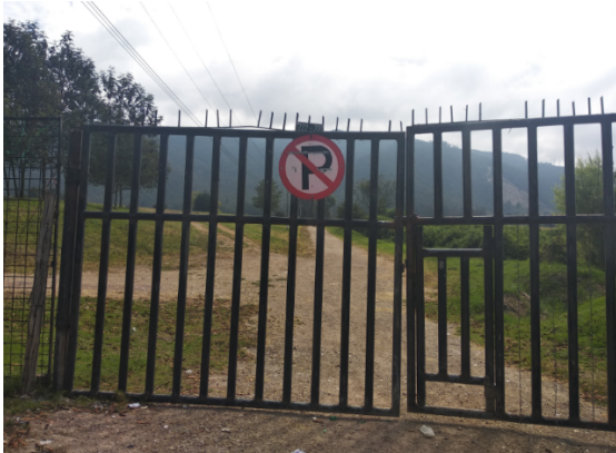
Fotografía 1. Vista general del predio