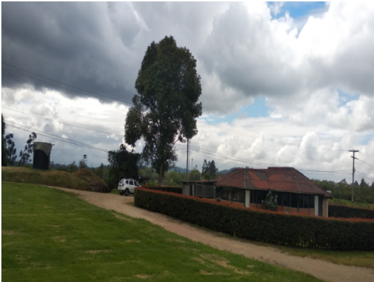
Fotografía 3. Única vivienda en el predio